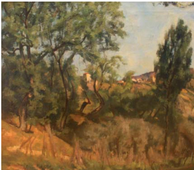
↑ Nino Bertocchi, Le Selve , 1942, olio su tela, 96x90

nord-est nei pressi di Monte Adone, con arbusti e lecci; le zone boscate nei pressi del corso di Setta e Savena; i boschi tipicamente appenninici dell'area sud, con querce, castagni e cerri.