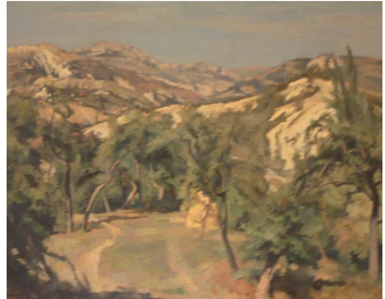
← Nino Bertocchi, Grotte a Monterumici , 1942, olio su tela, 67x58

Personaggio schivo e controverso, Bertocchi visse l’arte non come un semplice interesse, ma come una passione profonda, quasi una vocazione, alla quale decise di dedicarsi e rimanere fedele fino agli ultimi giorni della sua vita: il dipinto “ultime rose” fu infatti terminato il 22 giugno del 1956. Il giorno successivo, l’artista moriva a Monzuno. Alla sua morte lasciò circa 150 opere, le uniche sopravvissute alla tendenza dell’autore a distruggere i dipinti che, a suo giudizio, “non reggevano”. La sua tomba monumentale, opera dell’architetto Melchiorre Bega, si trova nel cimitero di Monzuno.