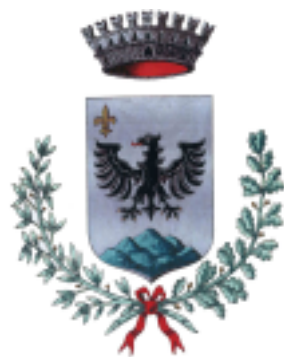
Comune di Monzuno

Per lo sportello di ascolto ginecologico i ragazzi, accompagnati da un genitore se minorenni, potranno accedere l'ultimo martedì del mese dalle 15,30 alle 18,30 senza appuntamento. Per l'accesso si seguirà l'ordine di arrivo, nell'ambito degli orari indicati.